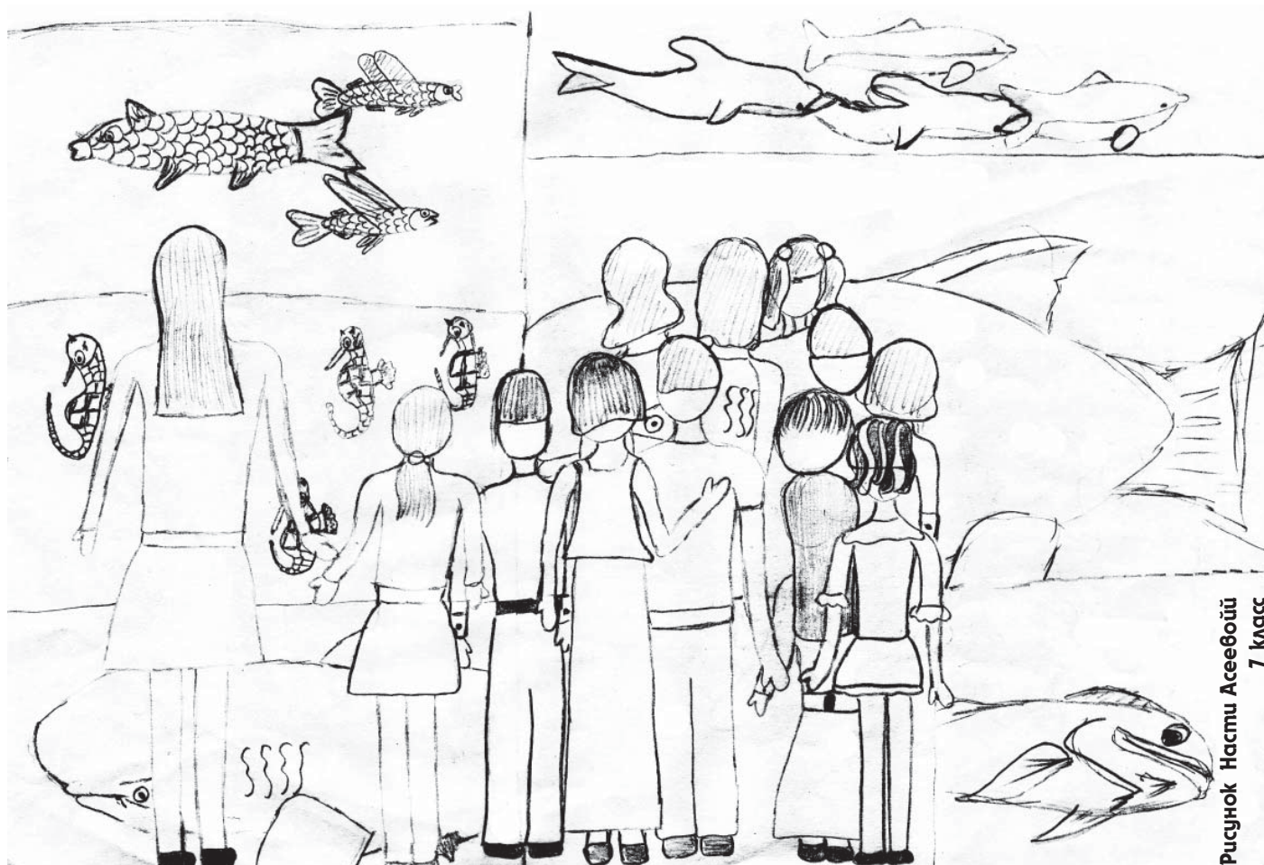
Рисунок Настю Асеевой 7 класс

22 марта все вторые классы отравились в океанариум. Ребята ходили по залам с аквариумами и смотрели на неизвестных водных обитателей. Было так много разных видов рыбок, что глаза разбегались. Там были окуни, сомы, щуки, и рыба-весло, и рыба-клоун... А еще второклассники увидели рыбку, которая бьется током — ската. Все вздрогнули при виде кровожадных пираний (но вздрогнуть не значит испугаться, ну, может, чуть