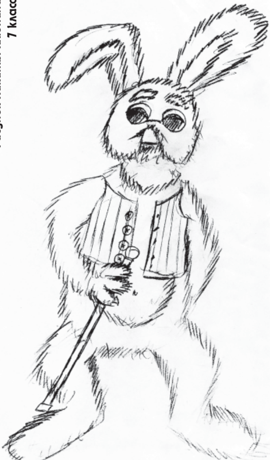
Рисунок Никиты Кляонина 7 класс