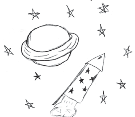
Рисунок Дмитрия Яковлева 8-а класс

Первыми в космос полетели две беспородные собаки — Белка и Стрелка. 19