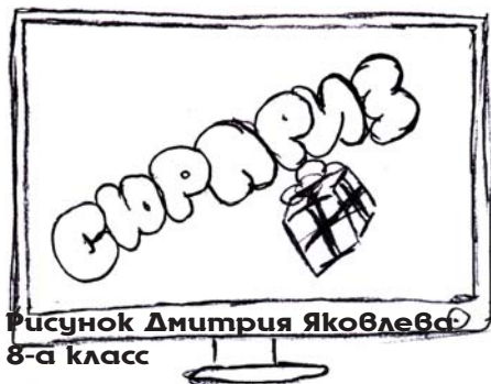
Рисунок Дмитрия Яковлева 8-а класс