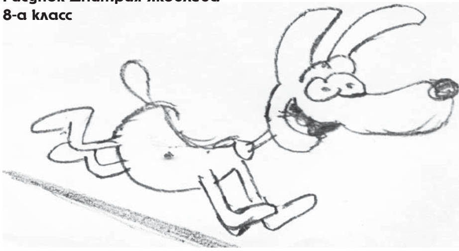
Рисунок Дмитрия Яковлева 8-а класс