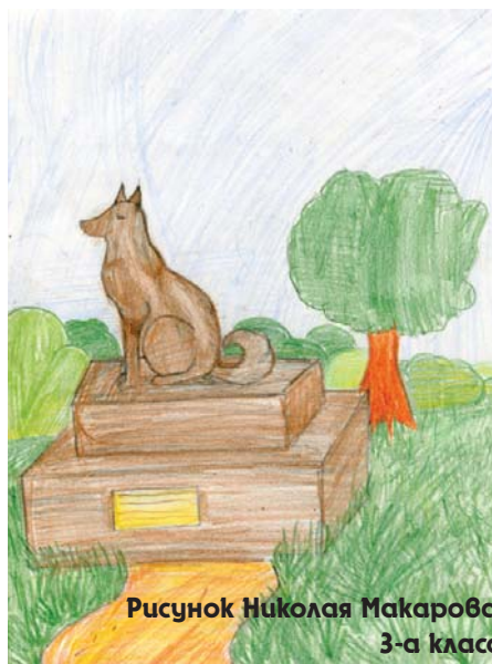
Рисунок Николая Макарова 3-а класс

августа 1960 года на корабле «Спутник» они отправились покорять неизведанное пространство. Эти собаки — первые живые существа, благополучно вернувшиеся на Землю после орбитально-