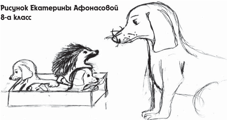
Рисунок Екатерины Афонасовой 8-а класс