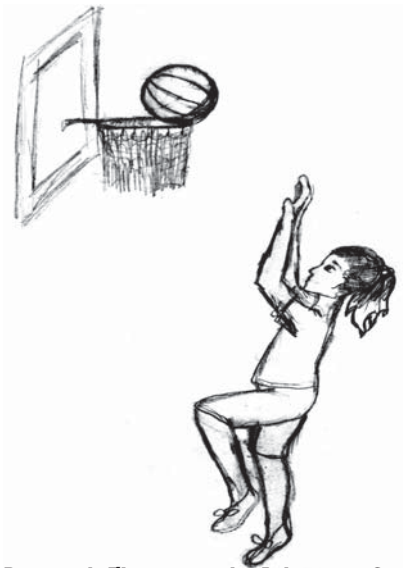
Рисунок Екатерины Афонасовой 8-а класс