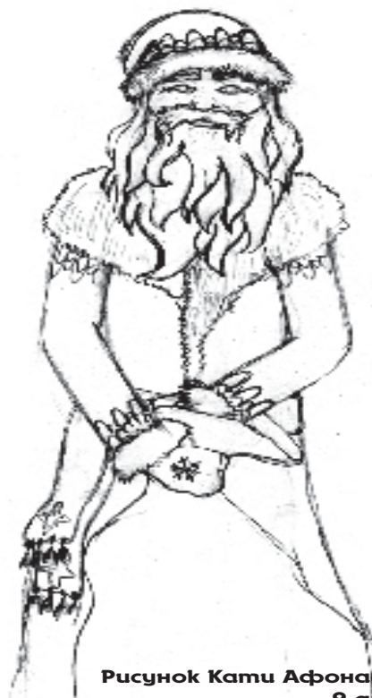
Рисунок Кати Афонасовой 9-а класс

Новый год — самый красивый, самый добрый и самый веселый праздник. Я его встретил так: днем я с братьями наряжал ёлку, вечером помогал маме накрывать на стол, позже мы всей семьёй сели за стол.