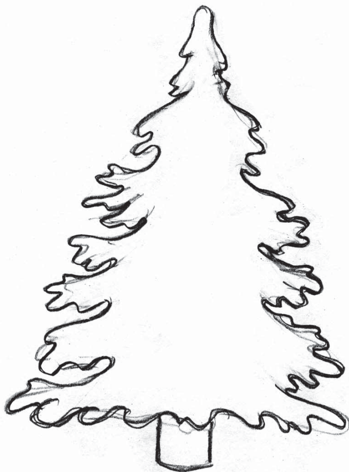
Рисунок Кати Афонасовой 9-а класс