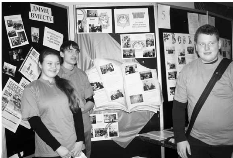
— это история, достойная, пожалуй, Задорнова. Ну а как ещё можно отнестись к двум девушкам, нагруженным бытовой техникой, если не со смехом.

А ещё наш медиа-центр получил приз как наиболее результативно действующее объединение — микроволновую печь. Было, конечно, очень приятно получать призы, но то, как мы потом несли микроволновку и два чайника (один — наш за проект «Если тебе 15...», второй — объединения «Никоша» за проект виртуальной выставки, посвященной ветеранам войны)