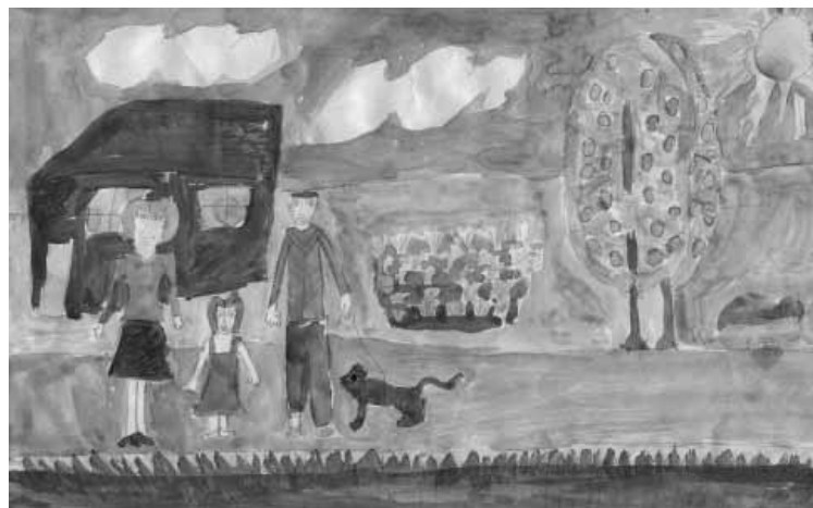
Рисунок Даши Бахваловой 3-6 НСОШ № 3