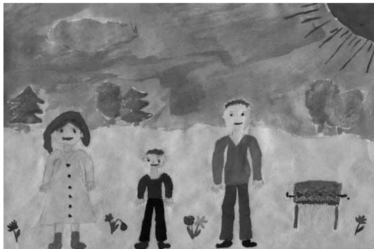
Рисунок Никиты Власова 3-6 НСОШ № 3

Я вот сравниваю свою семью, в которой живу, и бабушкину. Времена изменились, и изменилась обстановка в семье. Я очень люблю своих родителей, но не всегда слушаюсь их. Мне, конечно, всё прощают. Но вот, допустим, жила бы я в семье моей бабушки. Я бы без завтрака, без обеда и ужина оставалась изо дня в день. Ложкой по лбу получала бы каждый раз и на улице бы не ходила. Так что я поняла: надо ценить семью, в которой живешь, любить и уважать своих родителей.