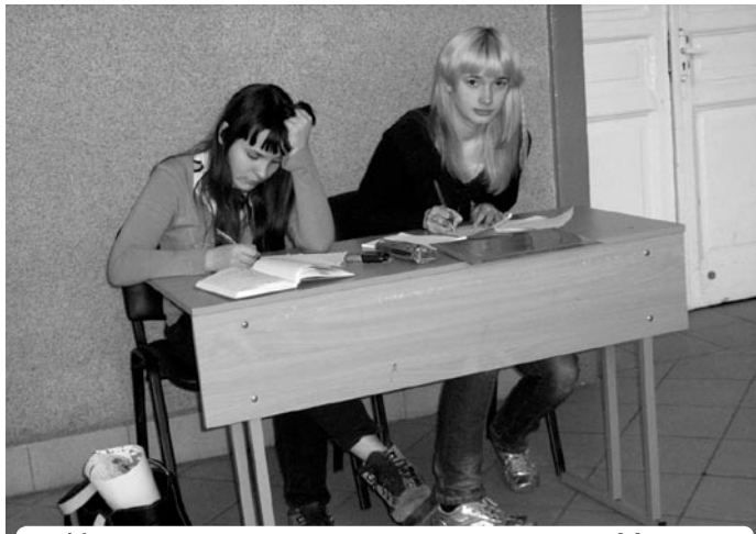
Наши корреспонденты в ожидании Музы