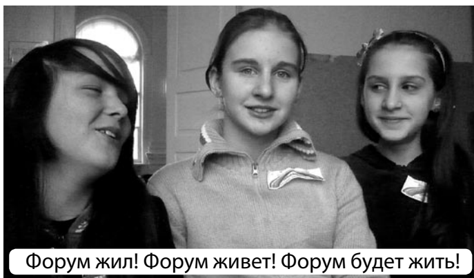
Форум жил! Форум живет! Форум будет жить!

Газета сделана новым поколением ДММЦ "ВМЕСТЕ"