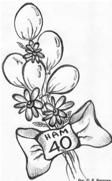
Рис. О. В. Вереток

14 декабря мы принимаем поздравительные телеграммы. Пишем вместе, всей семьёй Поздравленья текст простой! Ярко-ярко оформляем — Прямо в школу доставляем!