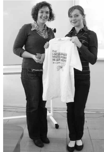
На эти и многие другие вопросы вы найдёте ответ на сайте yadonor.ru

Как можно присоединиться к Донорскому движению?