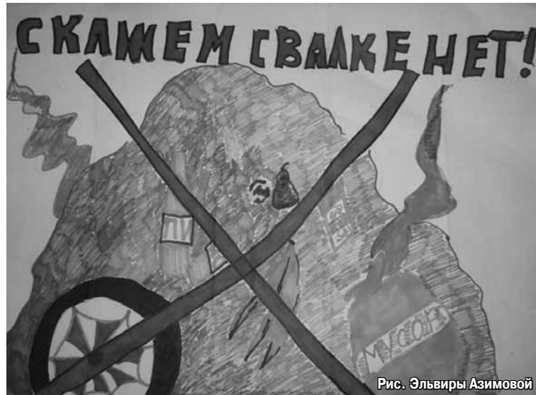
Рис. Эльвиры Азимовой

Мы рассказали, что экология — одно из самых важных направлений в работе гимназии. И начинается она уже в начальной школе. Жюри очень понравился проект «Мы в ответе за тех, кого приручаем», реализованный в прошлом году нынешними четвероклассниками, которые подняли вопрос о брошенных собаках.