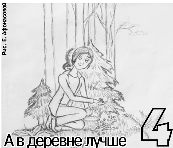
А в деревне лучше