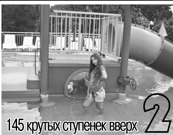
145 крутых ступенек вверх