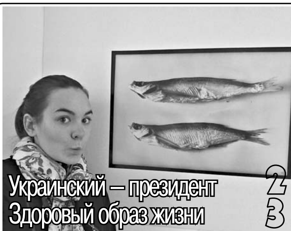
Украинский — президент Здоровый образ жизни