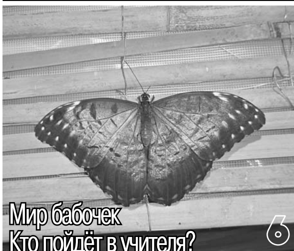
Мир бабочек Кто пойдёт в учителя?