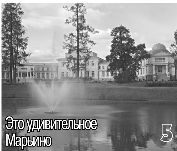
Это удивительное Марьино