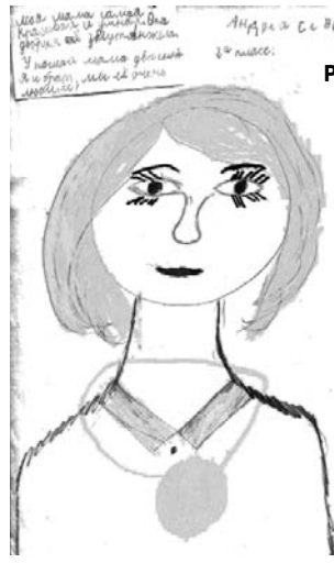
Рис. Андрея Севостьянова

А вот так своих мам поздравили второклассники – рисунками и стихами.