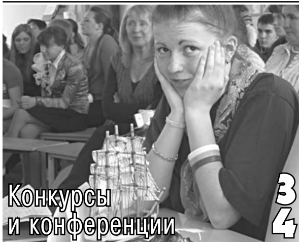
Конкурсы и конференции 3 4