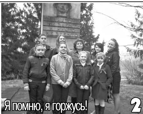
Я помню, я горжусь! 2