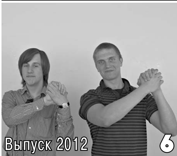
Выпуск 2012 6