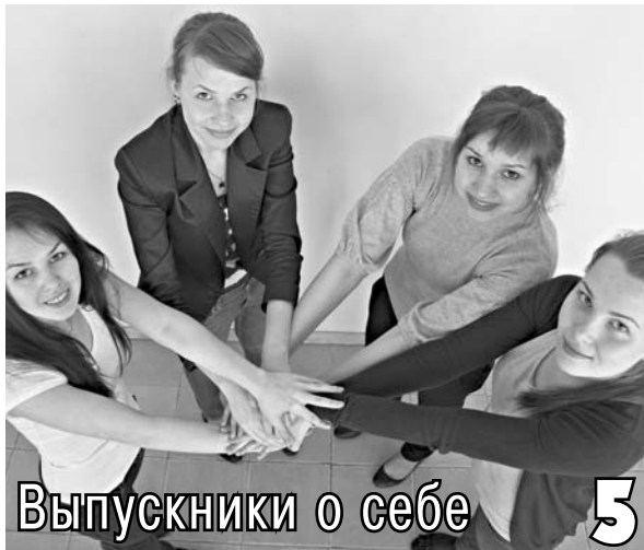
Выпускники о себе 5