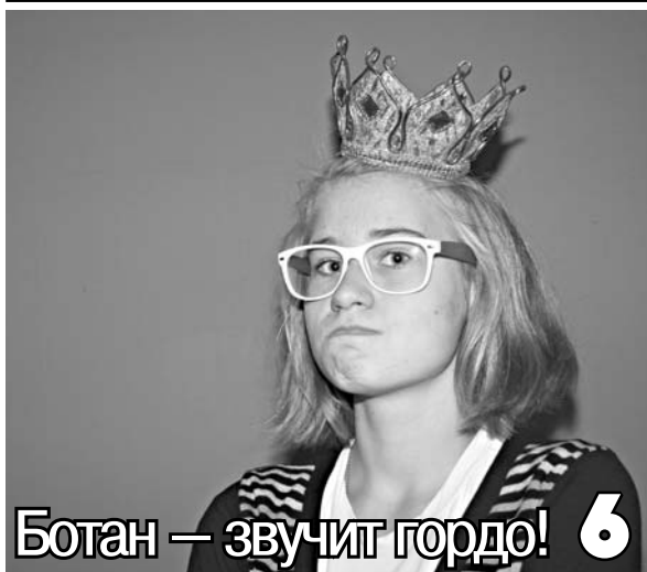
Ботан — звучит гордо!