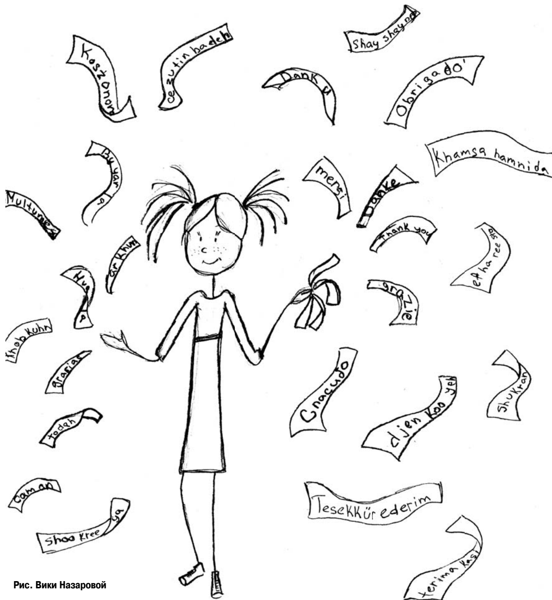
Рис. Вики Назаровой

Практически все опрошенные признались, что у них были ситуации, при которых не смогли сказать «спасибо»: