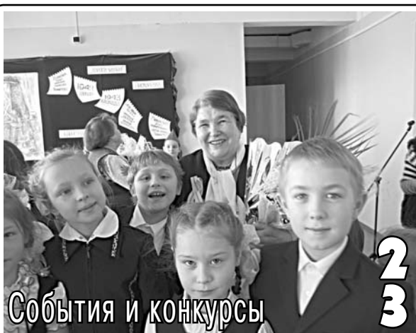
События и конкурсы