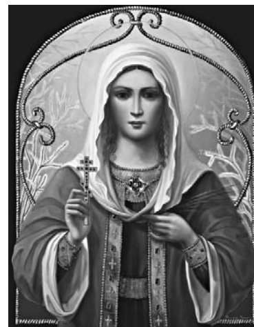
Возможно, именно так выглядела Татьяна Римская

Лишь некоторые уверены, что День Студентов — хороший повод провести время с друзьями: «А у нас вечеринку от института планируют, уже много праздников отмечалось в клубе всем институтом, так что будет весело». «Буду рада этот день отметить: у меня 4 экзамена из «пятерки» сданы».