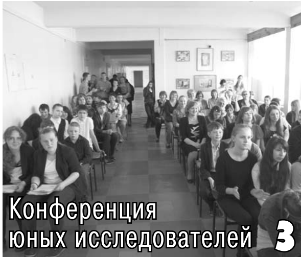
Конференция юных исследователей 3