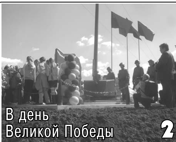
В день Великой Победы 2