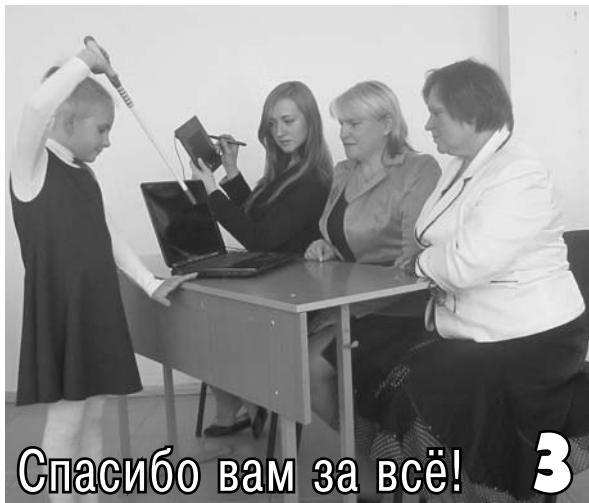
Спасибо вам за всё!