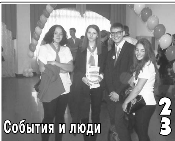
События и люди