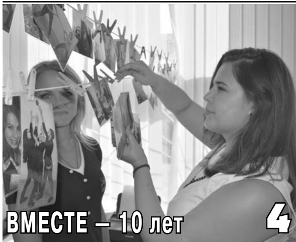
ВМЕСТЕ – 10 лет