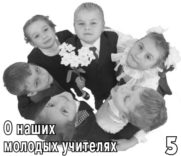
О наших молодых учителях