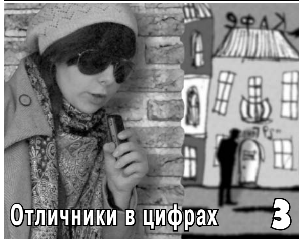
Отличники в цифрах 3