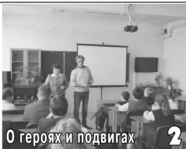
О героях и подвигах 2