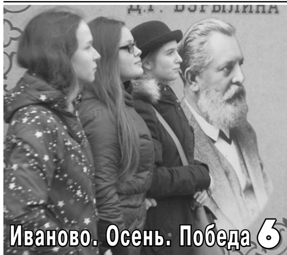
Иваново. Осень. Победа 6