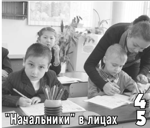
"Начальники" в лицах 4 5