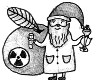
Рис. Светланы Коноховой

Пришло время волшебства и исполнения всех желаний, время «дарения подарков»... Мы, затаив дыхание, ждали Деда Мороза. И он пришёл с мешком и «в бороде», подозрительно